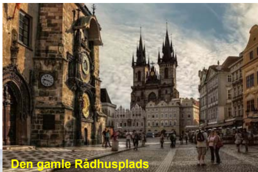
Den gamle Rådhusplads

Der er meget at se og opleve i Prag, og det er naturligvis umuligt at nævne det hele i dette hæfte. Du får et informativt deltagerhæfte udle-