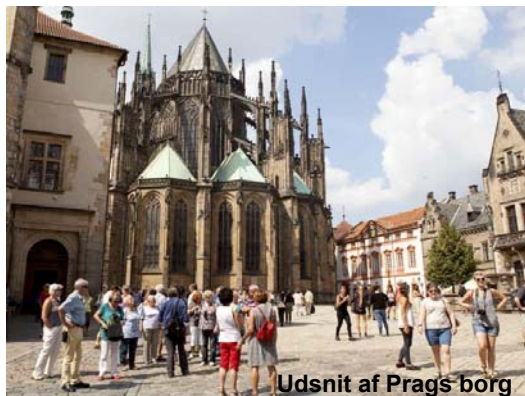
Udsnit af Prags borg

Prag er en utrolig flot by, beliggende i hjertet af Europa. Byen var i århundreder en af verdens førende hovedstæder og der findes talrige minder fra denne tid - ikke mindst i det gamle centrum og på Prags borg.