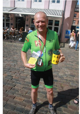
I år kører Tour de Bière feltet velgørenhedspenge ind til Natteravnene.