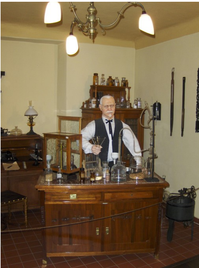
Tjekkiet er i sandhed pilsnerens vugge. Før den 5.