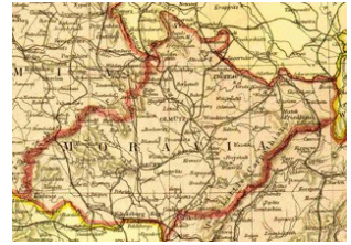
Morava, Moravia, Mähren