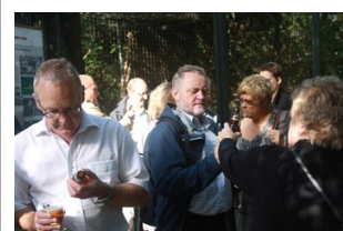
Foran Tigerhuset fik vi