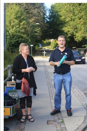
Velkommen til Aalborg