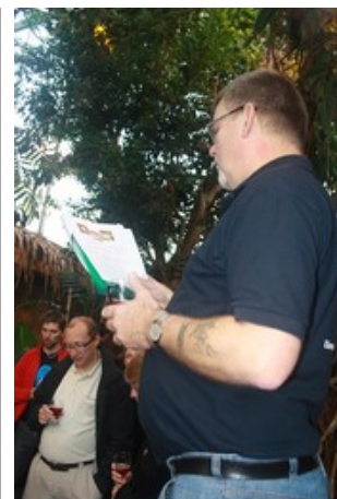
"Kiss the frog" fra Hornbeer...