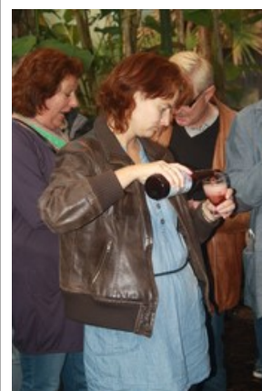
I paddehuset smagte vi