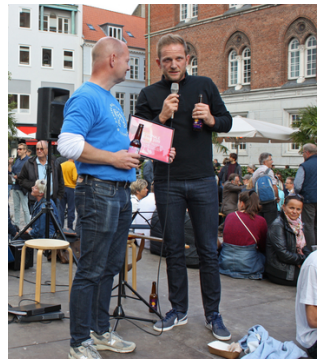
Bryggeriet Vestfyen modtog den regionale ølpris 2019 på Øllets Dag.