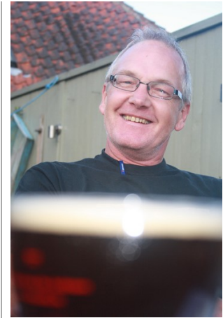
Mand i øl