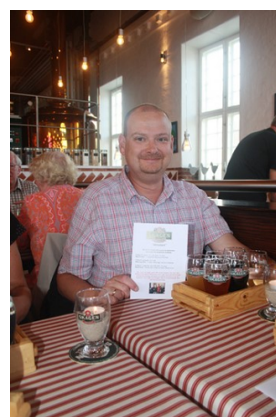
Glad mand med smagesæt