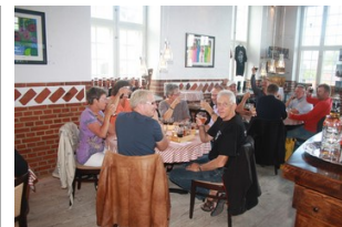
Så skåler vi