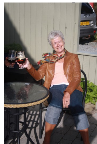
Skål i Gulden Draak