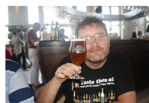
Lokalformand i hopla