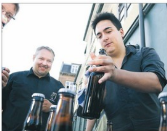
Lørdagens Beerwalk begynder hos John Bull Pub, som havde brygget af Nordjyske, der gav en smag på fem bryg. 11 var der i den anden aften var ikke så mange, her skænktes Labb og Søl og gik af.